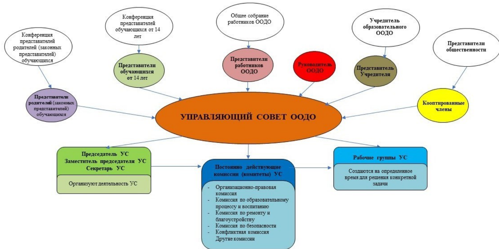
Рис. 2. Модель № 2 – «Управляющий совет образовательной организации дополнительного образования» (УС ООДО)