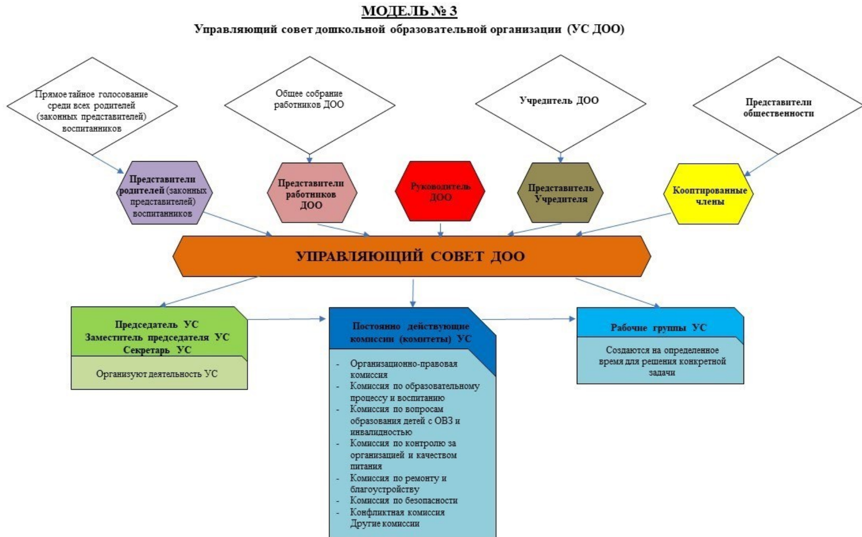
Рис. 3. Модель № 3 – «Управляющий совет дошкольной образовательной организации» (УС ДОО)