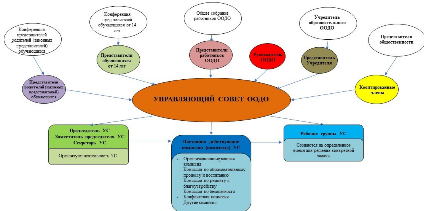
Рис. 2. Модель № 2 – «Управляющий совет образовательной организации дополнительного образования» (УС ООДО)